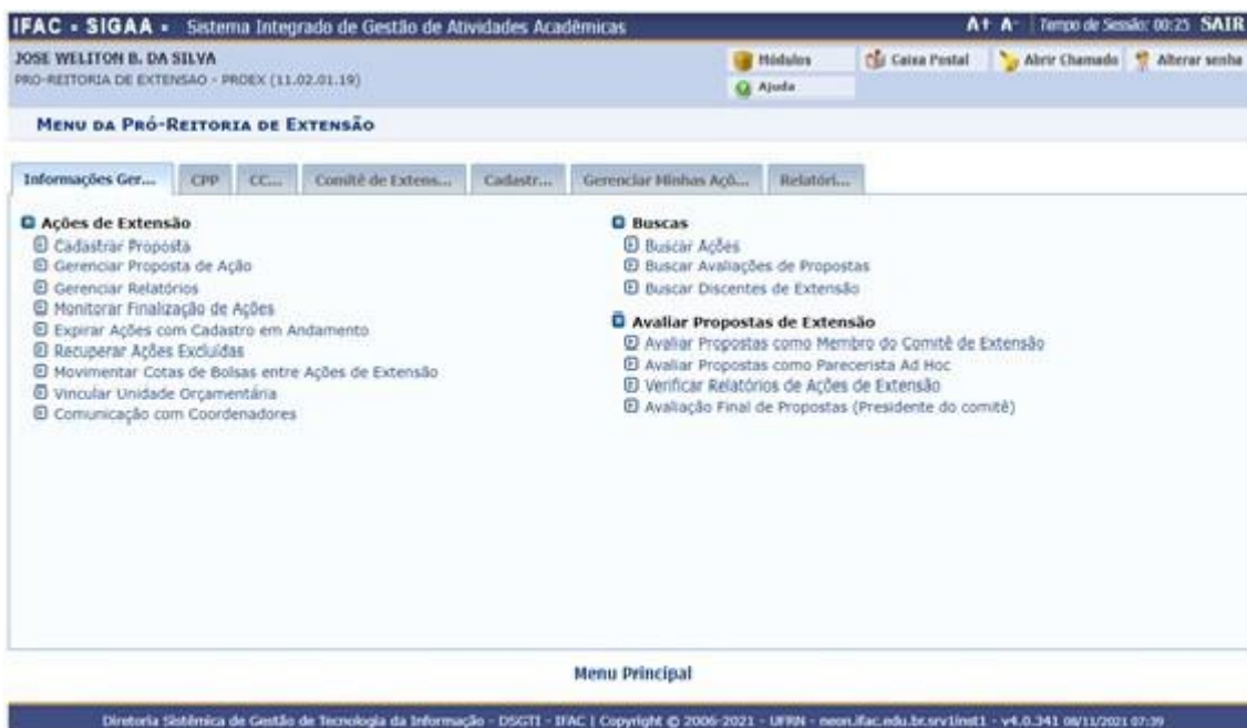
Figura 1 que consta no documento SEI nº 0426206, do processo SEI nº 23244.005733/2021-14.

Informamos que foram recebidos relatórios finais no período 20 de agosto até 05 de novembro de 2021. Conforme informações abaixo atualizadas.